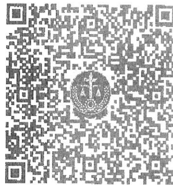
“集资参与者信息登记核实系统”二维码